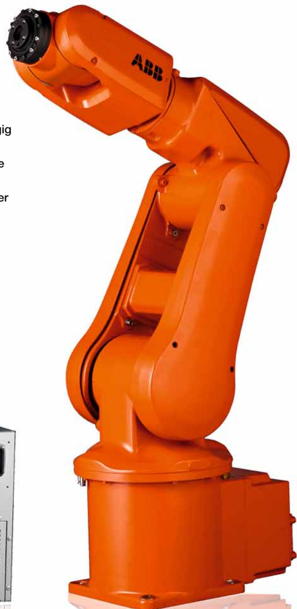
ABB ist einer der führenden Hersteller von Industrierobotern und hat entscheidend zu ihrer Verbreitung im Fertigungsbereich beigetragen.

Der IRB 120, ein Tischroboter für Lasten von bis zu 3 kg und der neueste Roboter von ABB, eignet sich für eine Vielzahl von Aufgaben einschließlich der Handhabung und Montage von kleinen, empfindlichen Komponenten.