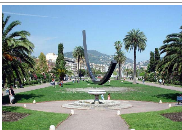
Grünanlage: Jardin Albert I