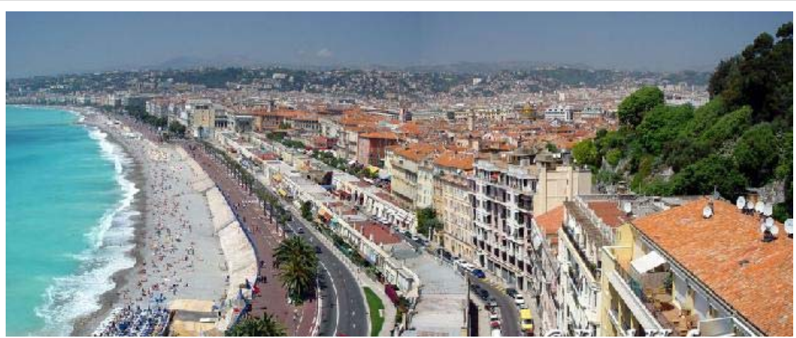
Strand und Promenade: Quai des Etats-Unis und Promenade des Anglais