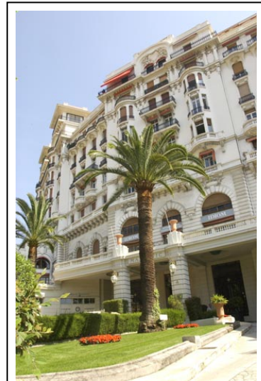
Die Schule: vornehmes Patri-zierhaus aus der viktoriani-schen Zeit, mitten im Zentrum von Nizza

Auch mit meiner Gastfamilie verbrachte ich eine schöne Zeit. Jeden Abend vor und während dem Essen wurde viel geredet und gelacht. Die zentrale