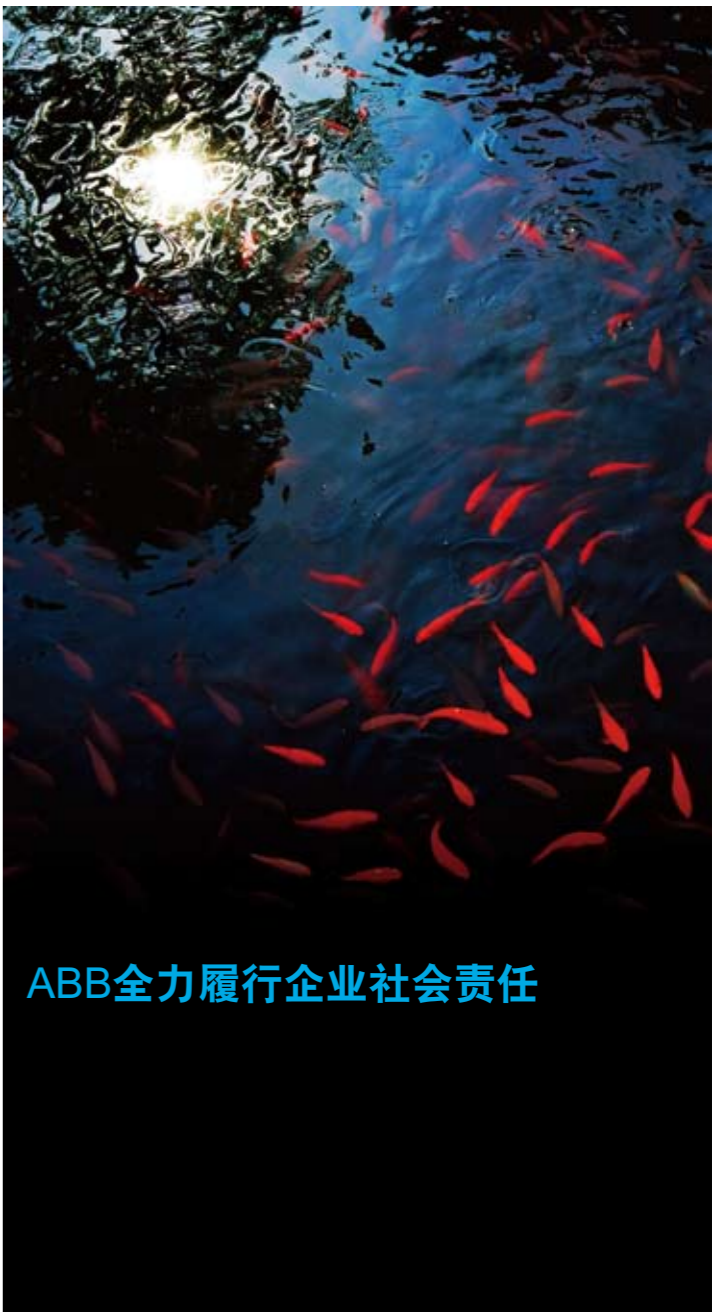
ABB ( China ) Limited Universal Plaza, 10 Jiuxianqiao, Chaoyang District, Beijing, 100016, P.R. China Tel : +86 10 8456 6688 Fax: +86 10 8456 7624 www.abb.com.cn

ABB（中国）有限公司 中国 北京市 100016 朝阳区酒仙桥10号恒通广厦 电话: (8610) 8456 6688 传真: (8610) 8456 7624