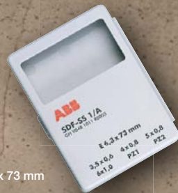
Bit-Box 73 mm