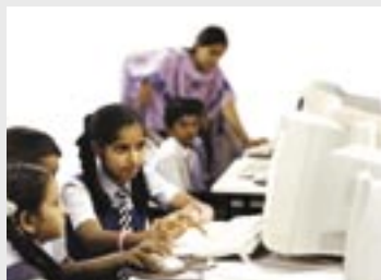
生まれ変わった教室で勉強に励む子供たち

同小学校では、月 3 ドルで 1 人の子供に 1 カ月分の給食が支給されるため、ABB の従業員たちは子供たちの「スポンサー」になっています。給食事業は、