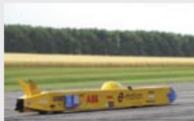
世界記録達成なるか？ ABB e=motion

ABB の e=motion カーのスポンサーシップは、ABB が推進している環境保護活動の象徴です。ダウ・ジョーンズのサステイナビリティ・インデックス (DJSI) において、ABB は自社とその顧客の成長目標、および環境保護を同時に促進する「トリプルボトムライン」を達成している企業として、常にトップクラスの評価を得ています。