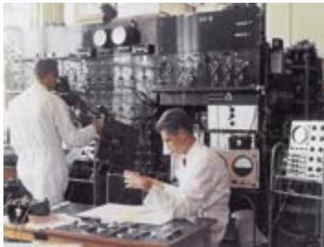
ゴットランド当時の HVDC の実験設備

北国の短い秋が終わろうとしている 1961 年（昭和 36 年）11 月、バルト海に浮かぶスウェーデンのゴットランド島に数人の日本人が降り立ちました。男たちは日本のトップクラスの電力技術陣による「両サイクル連系問題委員会」のメンバーです。スウェーデン本土とゴットランド島間で、ABB が世界初の実用化に成功した HVDC を調査するためにこの島を訪れました。