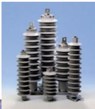
ABB 株式会社は 2004 年 4 月、株式会社明電舎と合併で MSA 株式会社を創立しました。ABB が誇る世界トップクラスのポリマー型アレスタ技術と、明電舎が持つ国内アレスタ市場における豊富な実績という両社の強みを活かして、日本市場で事業を展開いたします。

ABB がポリマー形アレスタ技術のライセンスを MSA に提供し、MSA が製品の開発、製造、販売を行います。また、資材購入、研究・開発についても ABB と明電舎が共同で取り組み、技術、価格、品揃えなどあらゆる面で市場競争力を強化します。国内トップシェアをめざすと同時に、国際競争力の強化を図る所存でございます。