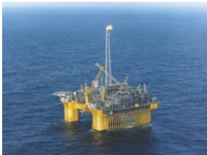
「サハリン 2」では海上プラットフォームから LNG を採掘します（写真はイメージで同プロジェクトとは関係ありません）

「プロジェクトの契約は一日で締結しますが、設計とエンジニアリングは何年も続きます。顧客のもとに直接出向き、実際に会って問題を話し合う者がいなければなりません」