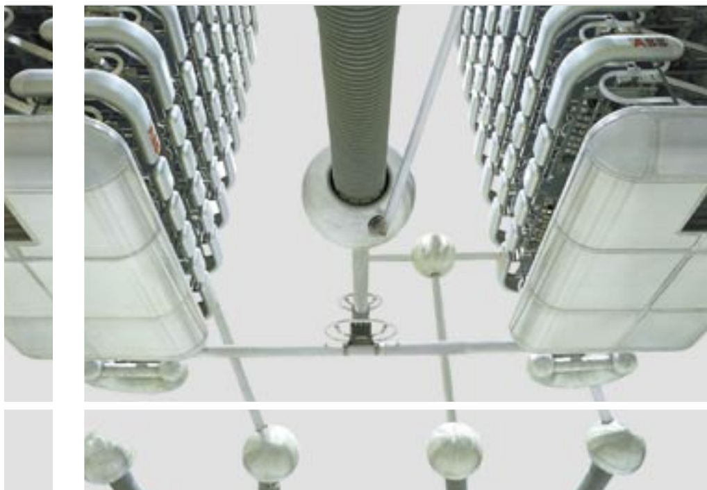
ABB グループの最新情報をお届けするニュースレター