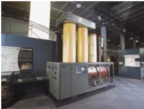
東京電力「電気の史料館」の水銀整流器

ABB が世界で初めて 1954 年に実用化した HVDC（高圧直流）送電技術。今年はその 50 周年に当たり、ABB は 5 月 6 日に記念行事をスウェーデンで行いました。…遠い異国での話に聞こえるかもしれませんが、実はこの技術が 1960 年代の日本の電力系統にも大きな影響を与えたのです。そしてその陰には、ヨーロッパと日本の電気技術者たちのドラマがありました。