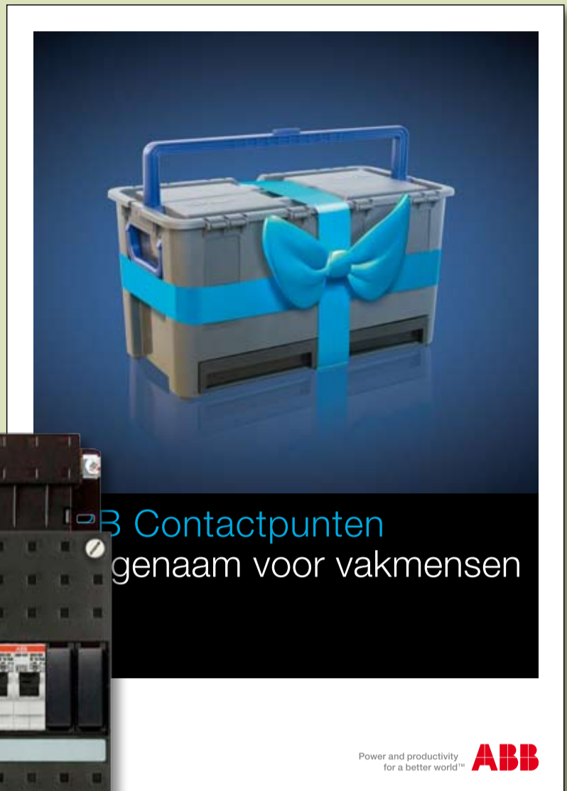
ABB Contactpunten Aangenaam voor vakmensen

Power and productivity for a better world™ ABB