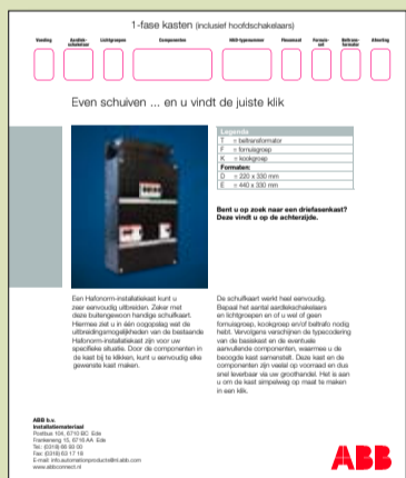
Door de componenten die in de tabel zijn aangegeven in de kast te klikken, kunt u eenvoudig elke gewenste kast maken.