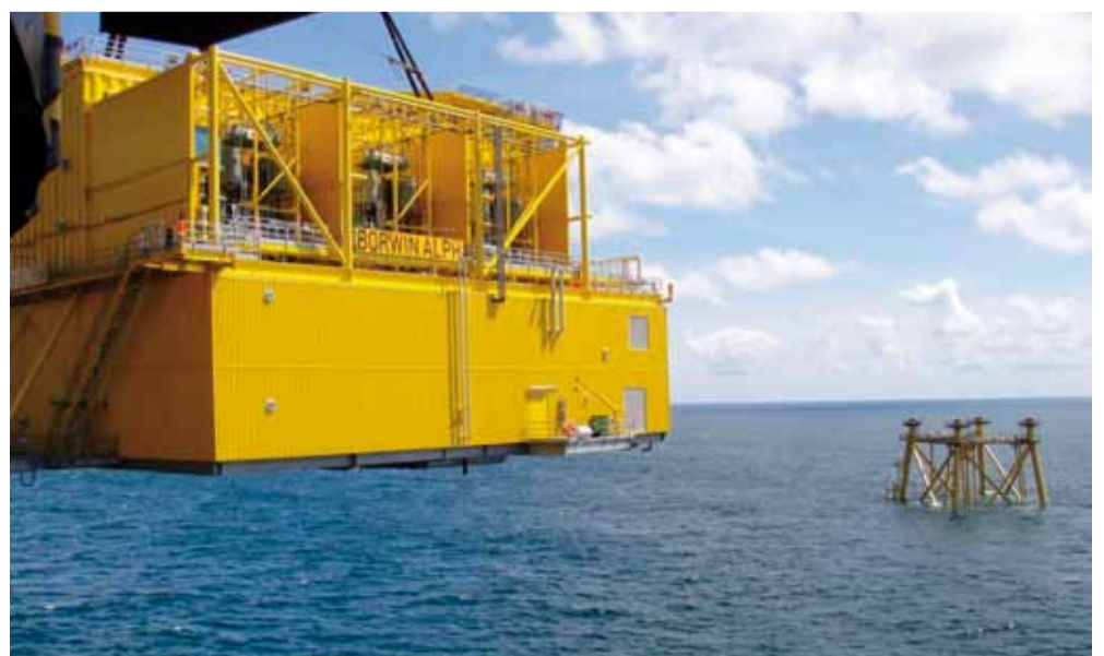
Het in Nederland gebouwde station met de HVDC-module voor het BorWin1-project wordt op zijn plaats gehesen.

Stuur voor meer informatie een e-mail aan: leo.pols@nl.abb.com