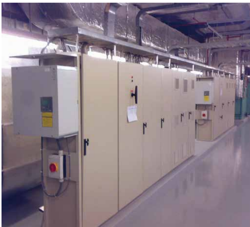
Een van de PQFS power quality filters gemonteerd in de technische ruimte van het Haagse stadhuis.

Stuur voor meer informatie een e-mail aan: robert.daems@nl.abb.com