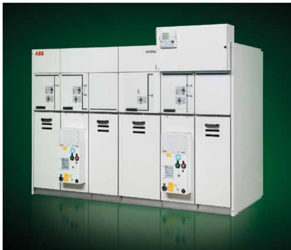
ABB eSI is EASY

Stuur voor meer informatie een e-mail aan: marcel.verhoeven@nl.abb.com