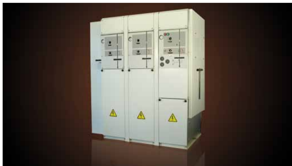
Voor het windpark "Vader Piet" op Aruba levert ABB compacte 36 KV schakelinstallaties van het type SafePlus.

in een container en tien middenspanningschakelinstallaties leveren voor de windturbines. Uniek is dat ABB voor de eerste keer de zeer