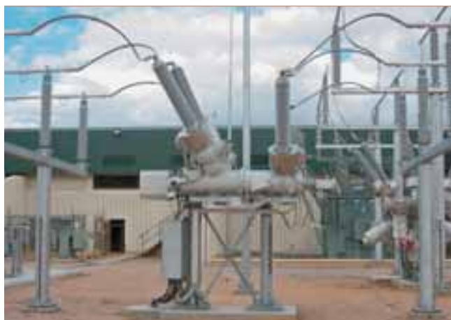
1 Компактный гибридный коммутационный аппарат PASS MO 170 кВ компании АББ объединяет в себе несколько функций.

Чтобы полностью использовать возможности мощных средств связи, устройства в подстанции должны обеспечивать расширенный набор данных при обмене информацией между собой. Это требование также отражено в их названии в стандарте IEC 61850 – интеллектуальные электронные устройства (Intellectual Electronic Devices, IED). Эти устройства управляют логическими узлами, которые представляют типовой функциональный элемент, который, например, может быть абстрактным представлением какого-либо физического оборудования, описывать средства управления таким оборудованием или представлять функцию защиты.